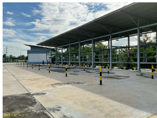
พื้นที่ที่มีความเสี่ยงไว้บริเวณพื้นที่ปฏิบัติงาน

รูปที่ 3-1 ภาพรวมของโครงการท่อส่งก๊าซธรรมชาติไปยังสถานีบริการก๊าซธรรมชาติหลัก บริษัท เครือข่ายก๊าซ ไทย-ญี่ปุ่น จำกัด ที่บ้านหมอ จังหวัดสระบุรี (ระยะดำเนินการ) ในปัจจุบัน (ต่อ)