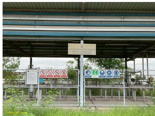
อาคารควบคุมความดันและวัดปริมาตรก๊าซ (Metering & Regulating Station)

รูปที่ 3-1 ภาพรวมของโครงการท่อส่งก๊าซธรรมชาติไปยังสถานีบริการก๊าซธรรมชาติหลัก บริษัท เครือข่ายก๊าซ ไทย-ญี่ปุ่น จำกัด ที่บ้านหมอ จังหวัดสระบุรี (ระยะดำเนินการ) ในปัจจุบัน