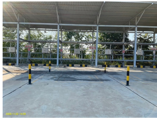
กำหนดพื้นที่สำหรับจอดรถของผู้มาใช้บริการ เพื่อป้องกันการเกิดอุบัติเหตุระหว่างการปฏิบัติงาน