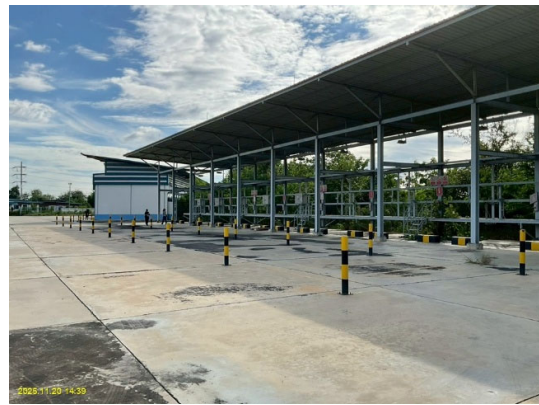
อาคารควบคุมการจ่ายก๊าซสำหรับรถขนส่งก๊าซ (Trailer Bay)