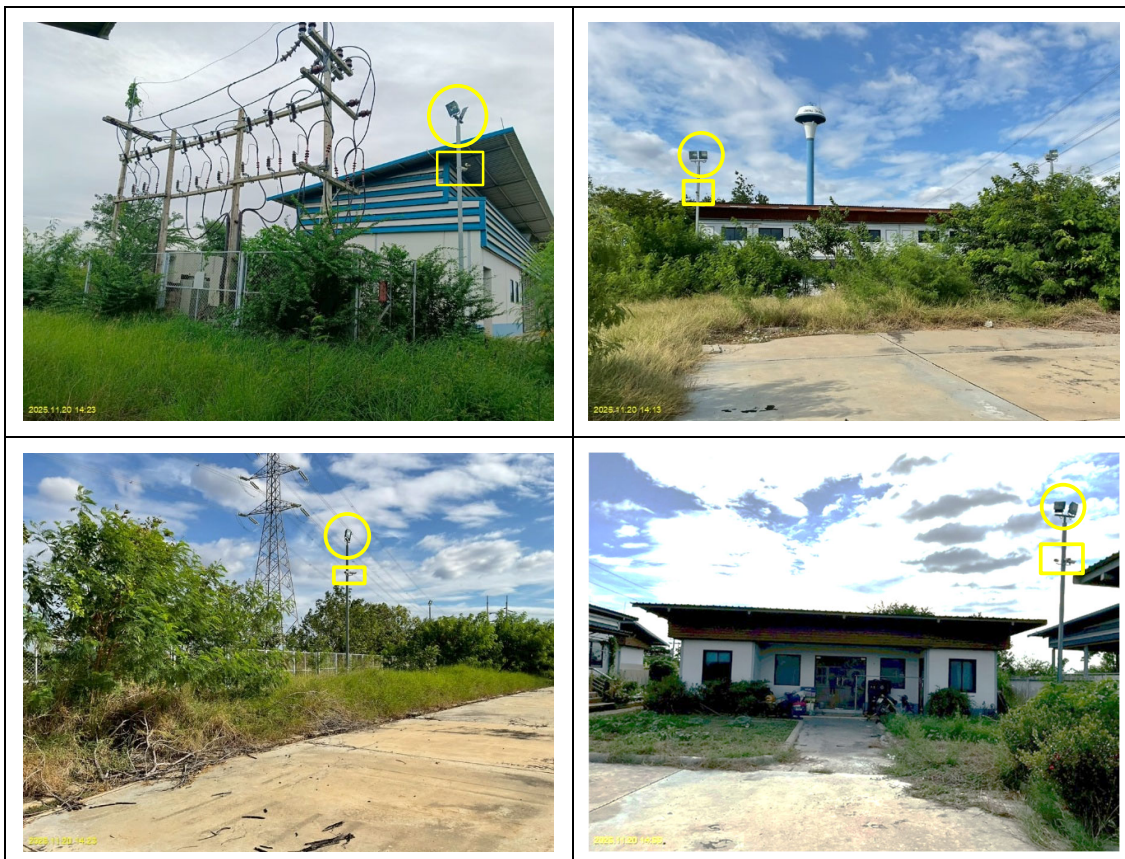
ติดตั้งโคมไฟส่องสว่าง และกล้องวงจรปิด (CCTV) โดยรอบสถานีบริการ ป้อมยาม และบริเวณอาคารสำนักงาน