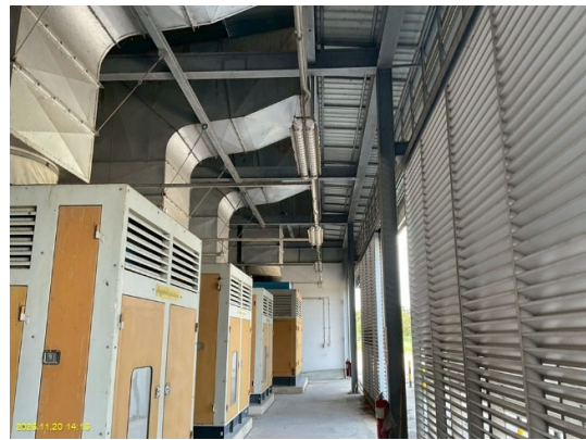
อาคารเครื่องสูบลำดับก๊าซธรรมชาติ (Compressor)