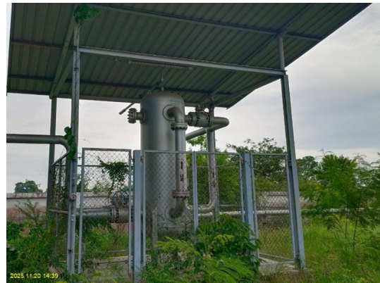
อาคารคลุม Buffer Tank