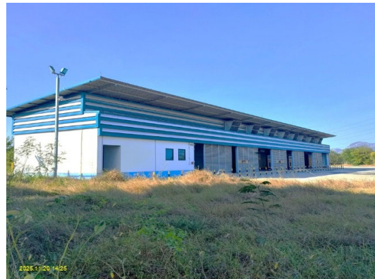
ห้องไฟฟ้า ทำหน้าที่สำหรับจ่ายระบบไฟฟ้าให้กับสถานีทั้งหมด